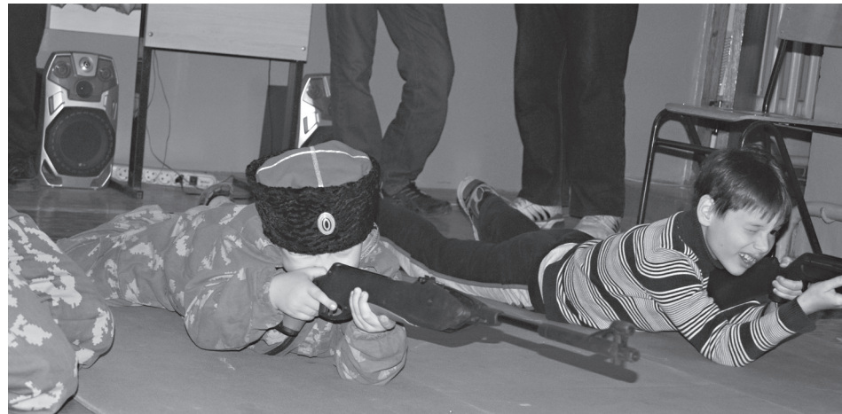
«Казачий дозор» на тренировках по стрельбе