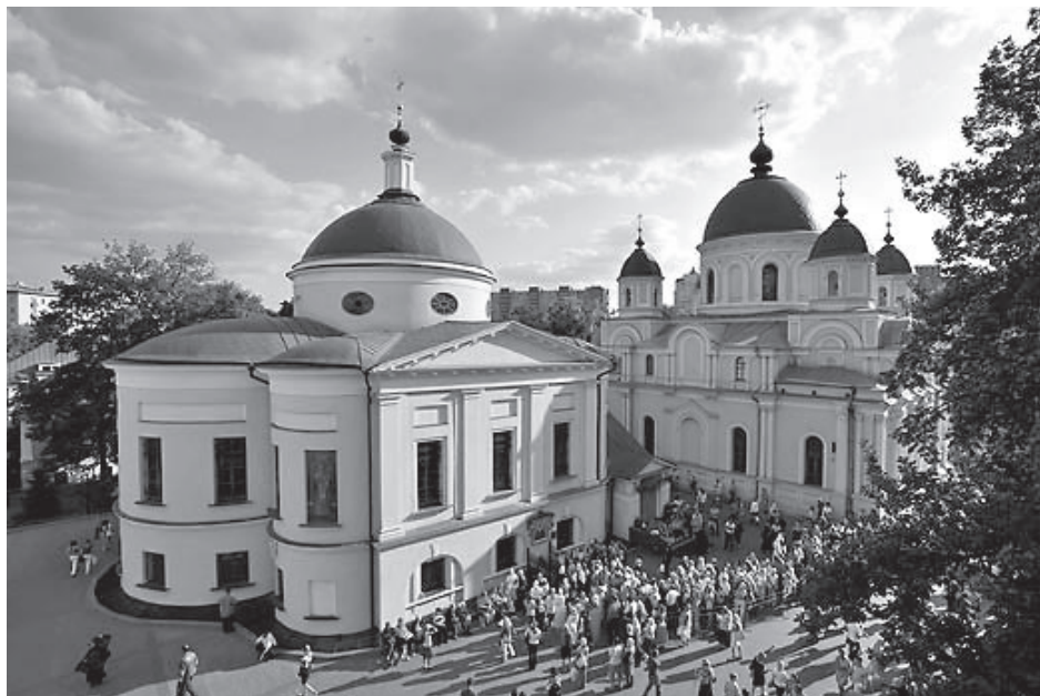
Покровский монастырь, г. Москва

Время многое изменило. Если раньше приезжих встречали лихие разносчики мороженого, удалыцы-носильщики да радостное «аканье» встречающих, то теперь картина иная. Обстановка стала более мрачной, деловой, а люди более зависимыми от работников железной дороги и транспортной милиции. Войти в вокзал, минуя рамки непонятно чего ищущих