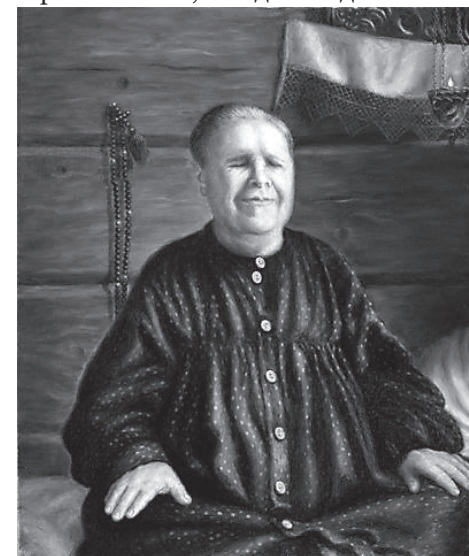
Блаженная Матрона Московская

мгновения нашего пребывания в вагоне, замелькали картинка: вот соседи по купе смотрят понравившийся им гаджет, вот телефоны лежат на столике между сумками и остатками провианта, вот мы собираемся положить их в пакет... Но телефонов нет. Мысли стали роиться, как снежинки, подхваченные ветром и кружащиеся в затейливом танце... Подумалось о цене на телефоны, большом количестве записанных в них очень нужных номеров, необходимости сегодня же позвонить в Самару и узнать, напечатаны ли в типографии газеты. Словом, началась паника. Что делать? Предположения посыпались как из рога изобилия. Варианты местонахождения телефонов стали приходить в голову один за другим. Конечно, на первом месте была версия, что мы забыли их в вагоне поезда «Самара-Москва». Но вроде бы столик во время выхода из купе был пуст. Однако воображение упорно рисовало картины завалившихся под матрац аппаратов, которые были в руках во время проверки правильности установки роуминга поздно ночью. Стало быть, надо ехать на вокзал, искать отправленный на запасный путь вагон поезда, а заодно проводницу, которая была очень сварлива и самоуверенна. Пришла мысль, что такая может взять телефоны и не признаться в этом. Стали строить планы, что делать дальше. Но