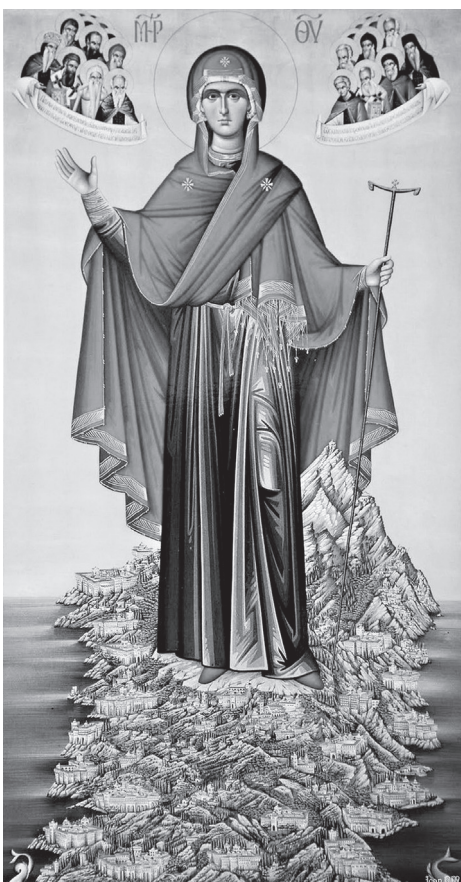
Икона Божией Матери «Игуменя Святой Горы»

Афон пешком и на авто - две разные истории. Убедился в верности поговорки, что в каждом монастыре свой устав.