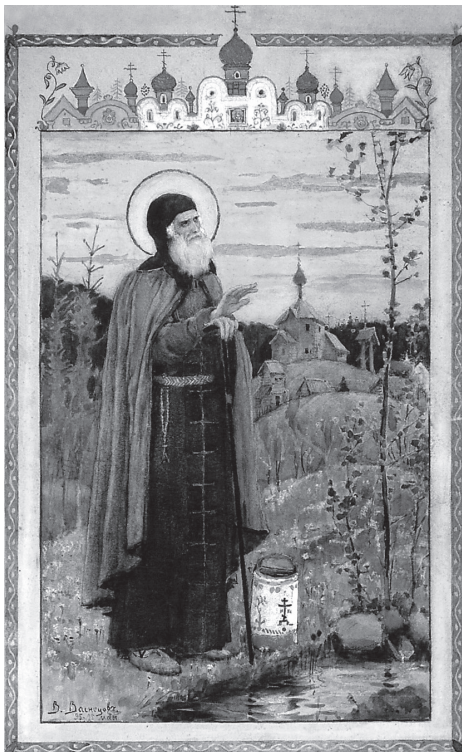
В. М. Васнецов. Преподобный Сергий Радонежский

изведенные в нем траты. Ворота Лавры Преподобного Сергия затворятся и лампы погаснут над его гробницей только тогда, когда мы растратим этот запас без остатка, не пополняя его».