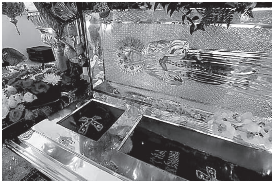
Святые мощи блаженной Матроны Московской в Покровском женском монастыре

нажать, а также как включать-выключать приспособление для общения.