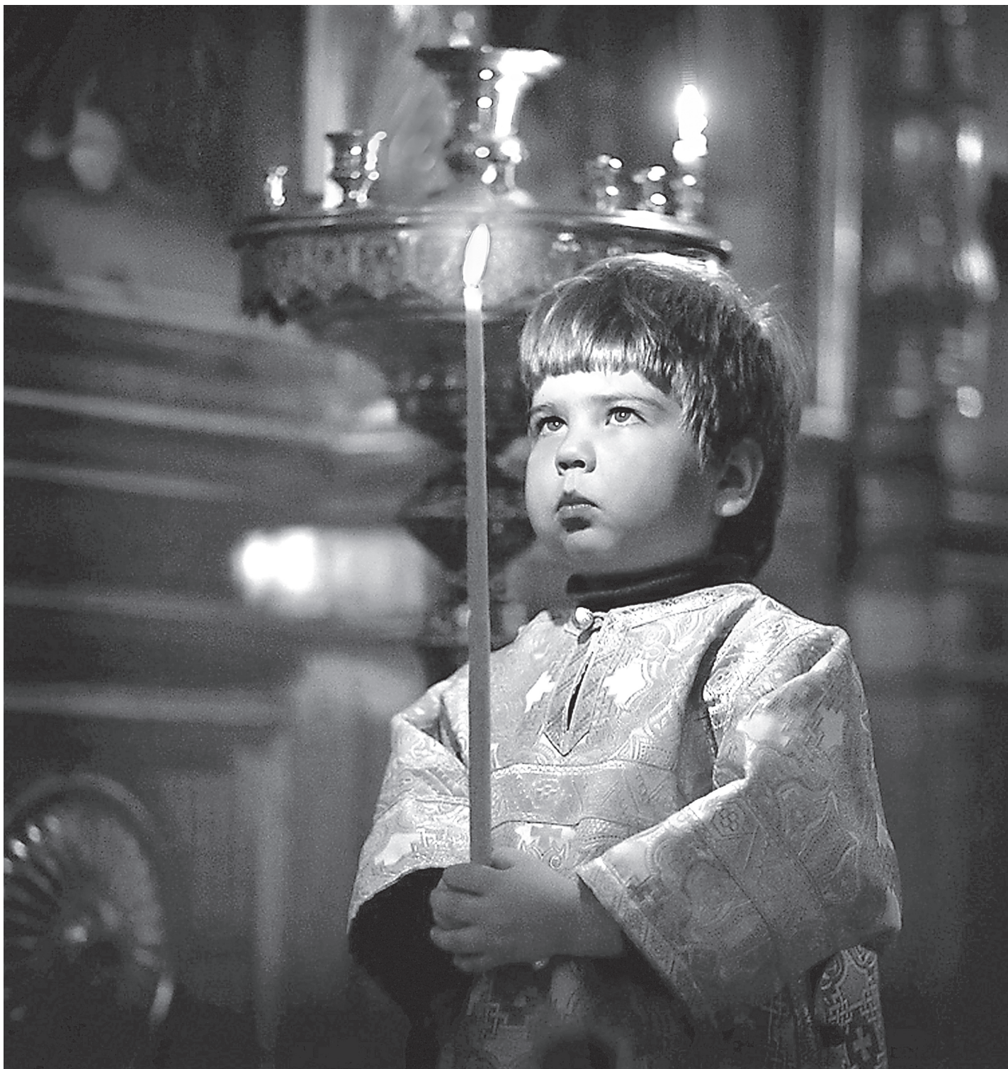
Так да светит свет ваш пред людьми, чтобы они видели ваши добрые дела и прославляли Отца вашего Небесного.

Поэтому помимо знаний Божиего закона нужно еще что-то иметь. Это «что-то» есть голос нашей совести. По совести нужно жить. Потому что совесть - это не благоприобретенное некое знание, которое приходит к человеку по мере получения образования. Совесть вкладывается Богом в душу каждого человека. И если живем по совести, если ее не разрушаем, то не только памятование о Божиих заповедях, но и голос своей собственной совести будет говорить: «Я поступаю гадко, мерзко. Да, я хочу достигнуть какого-то блага для себя. Не получится». Этот голос совести может в самый важный момент остановить человека и помочь ему не