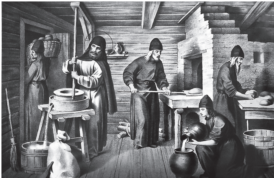
Фрагмент из жития Преподобного Сергия Радонежского