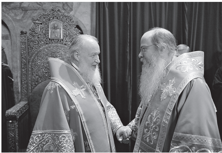
Перед началом молебна в крестовом храме Патриаршей резиденции

Затем в тронном зале Патриаршей резиденции состоялась братская беседа Предстоятелей двух Церквей, в ходе кото-