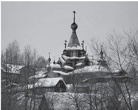
Храм в честь св. Иоанна Воина

скользнул в дверь и пришел, еле держась на ногах, в кухню.