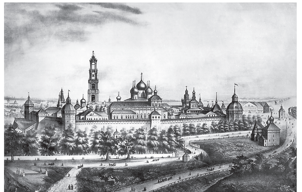
Троице-Сергиева Лавра. Общий вид, начало XIX века

Сказав об этом, зададимся вопросом: кто же такой русский святой и Преподобный Сергей как его идеальный