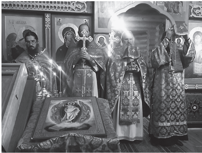
За Божественной литургией