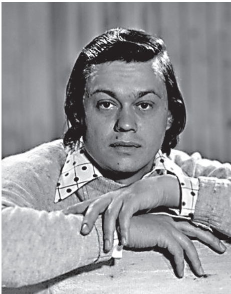
Николай Петрович Караченцов в молодые годы