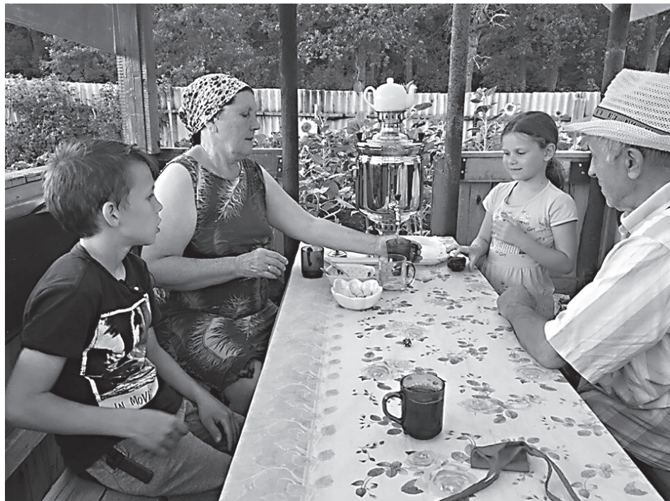
За чаепитием с новым тульским самоваром

Посвящается всем, кто меня по-своему поддерживает и любит