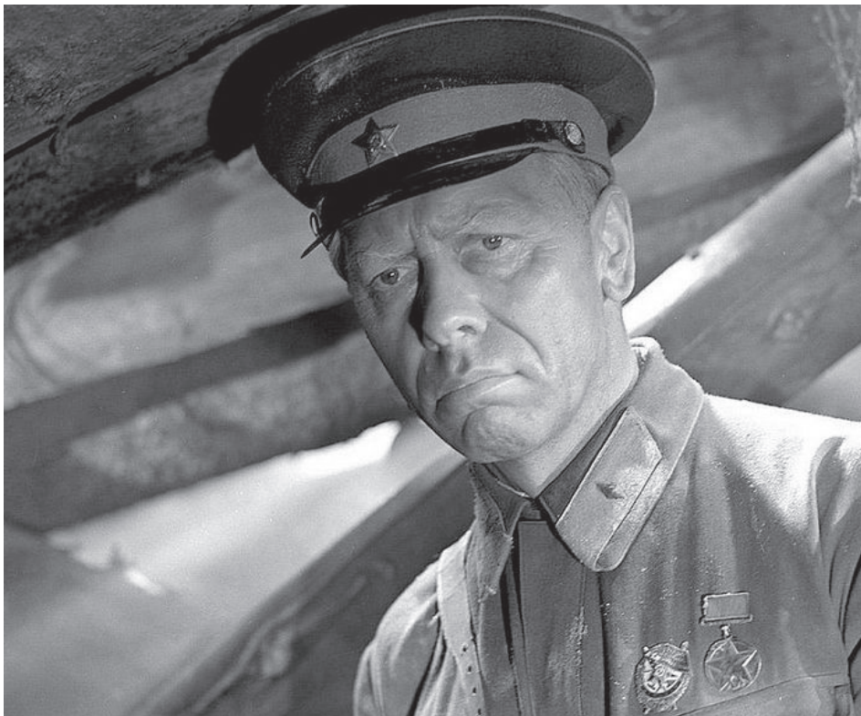
Анатолий Папанов в роли Фёдора Фёдоровича Серпилина в фильме «Живые и мёртвые», 1964 г

манной небесной». На первый взгляд, в словах командующего лишь жалоба на нехватку сил в критической ситуации наступления противника на Москву, однако за библейской фразеологией, пожалуй, кроется нечто большее: соединения, принявшие участие в легендарном параде 1941-го года, становились своего рода благословением судьбы, сулившим победный исход всей битве.