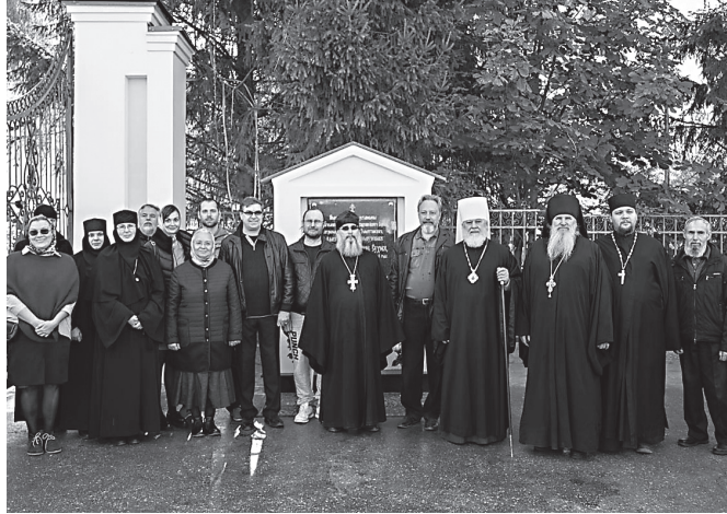
У памятной стелы