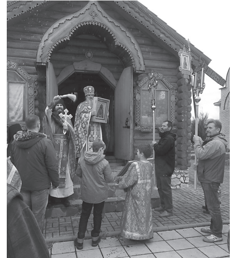
Праздничный крестный ход

Вот Грузия - православная страна - напала на Россию. Пришлось воевать. Православные воюют с православными. На Украине православные убивают православных. А сейчас хотят сделать так, чтобы верующие убивали верующих. И как они радуются этому. Конечно, Православная Русская Церковь заняла твердую позицию и прекратила Евхаристическое общение с Константинопольской Церковью. А как же иначе? Представьте себе, что Гитлер напал на нас, а мы продолжали бы торговать с ним, дружить, в гости друг к другу ездить. Это же невозможно. На войне, как на войне.