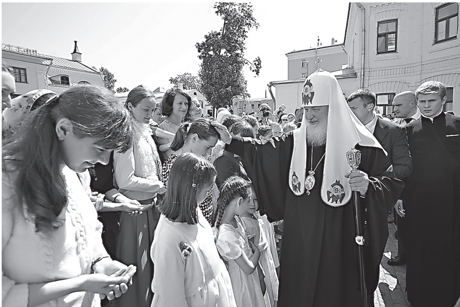
Святейший Патриарх Кирилл во время посещения Марфо-Мариинской обители милосердия

Н ам надлежит, каждому в меру своих сил, стать на путь преодоления злых помыслов, страстей, греховных деяний, которые сопровождают жизнь каждого человека. Для того, чтобы мы имели возможность совершить этот духовный разворот в своей жизни, Церковь предлагает нам определенные средства. В первую очередь, это молитва, которая дает возможность почувствовать Божие присутствие. Именно через молитву мы можем установить связь с Самим Богом и понять, что мы не одиноки, что в наших человеческих трудностях, в нашей борьбе мы можем опираться на Божественную силу.